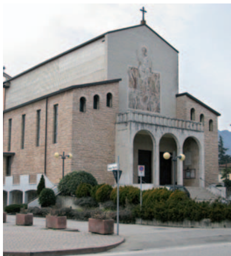
La chiesa parrocchiale del Sacro Cuore di Gesù a Schio.