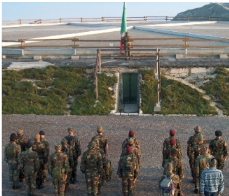
Gara Monte Grappa. Alzabandiera al Sacrario Militare