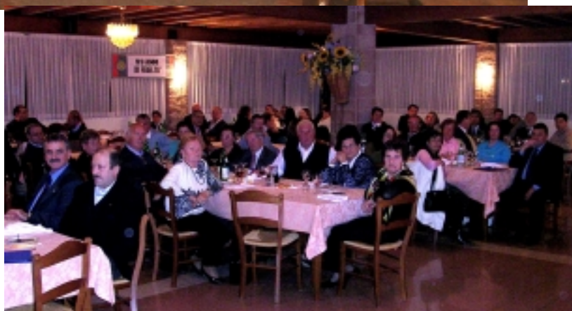
Virgo Fidelis 2005 - Cena al ristorante Noris

Anche nell'ultima Virgo Fidelis, vi è stata grande partecipazione degli iscritti con le rispettive famiglie. Dopo la SS. Messa come da programma il ritrovo con il Presidente nella consueta riunione annuale e a seguire la cena e il ballo