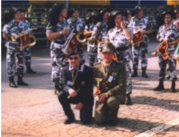
Foto dei vincitori con la la fanfara dei Bersaglieri di Desenzano