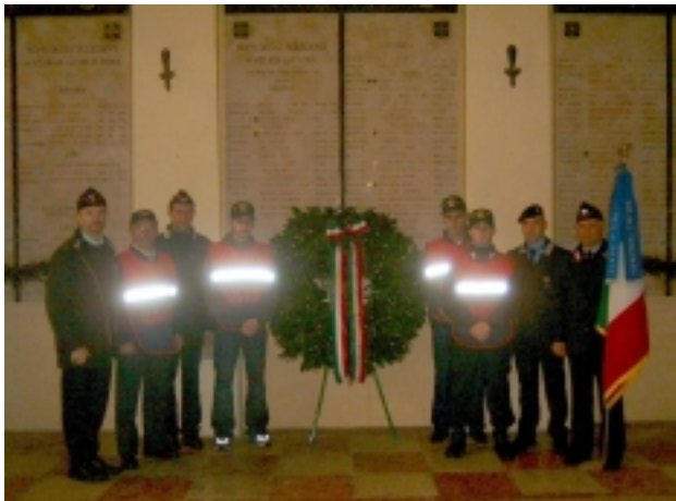
Sacrario militare SS- Trinità. Deposizione della corona ai caduti

Siamo stati presenti al Sacrario Militare di SS. Trinità come Associazione d'Arma rendendo onore ai caduti e partecipando alla deposizione della corona dopo la funzione religiosa. Unitamente alla cerimonia comunitaria si è svolta anche attività di sorveglianza alla manifestazione.