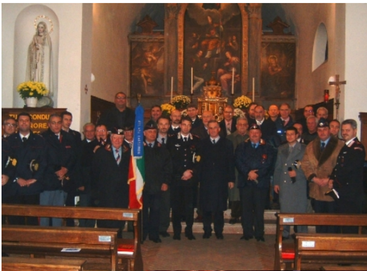
Virgo Fidelis 2005 – SS. Messa

Anche nell'ultima Virgo Fidelis, vi è stata grande partecipazione degli iscritti con le rispettive famiglie. Dopo la SS. Messa come da programma il ritrovo con il Presidente nella consueta riunione annuale e a seguire la cena e il ballo